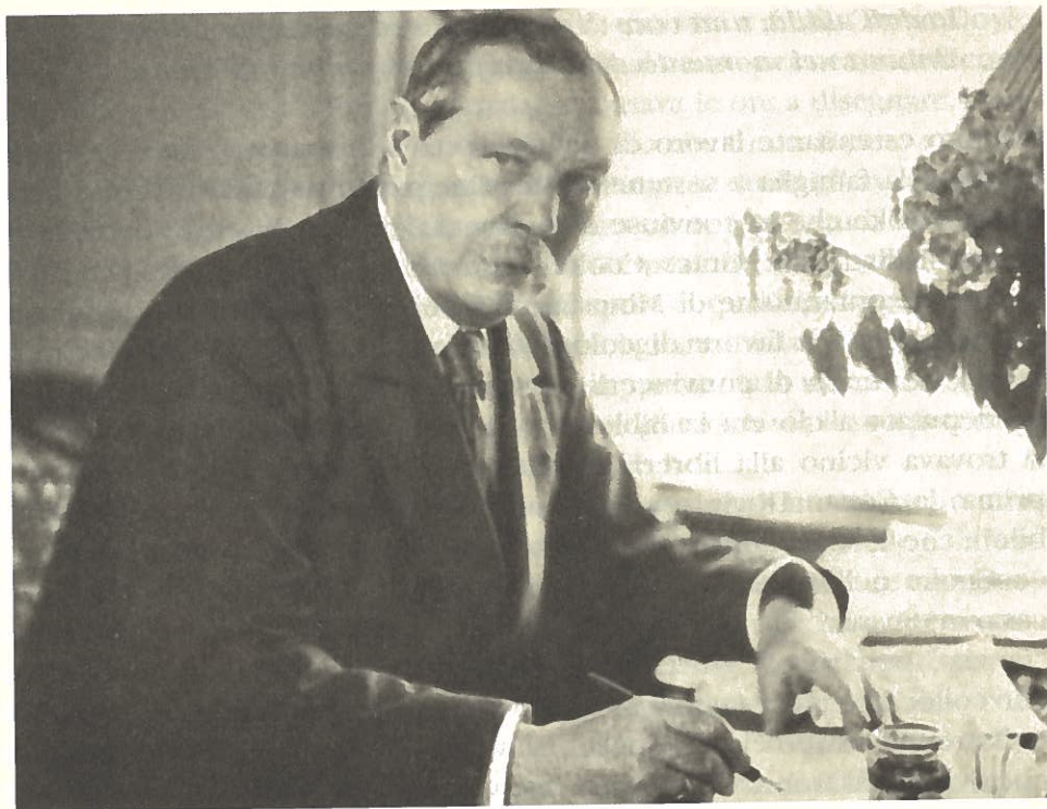
Arthur Conan Doyle al tavolo di lavoro

“Mi trovo in un “mondo celeste” indicibilmente bello. Desidero sopra ogni cosa far capire ai miei amici questa realtà: ma mi rendo conto fin troppo bene che essi ne potranno essere compartecipi solo se ne comprenderanno la natura. Questa è la profonda motivazione che mi spinge a diffondere la conoscenza della vita nell’aldilà. Ritengo che nella mia vita sulla terra ho già svolto una funzione di apostolato ed ora continuo questo lavoro, ma con modi e mezzi diversi. [...] Grazie a Dio la nebbia comincia a dissiparsi ed ora ho una visione più chiara di quanto non mi sembrasse possibile prima. E’ possibile che i miei amici si aspettino di intrattenersi con me sulle banalità della vita personale sulla Terra? Ormai io mi sono sbarazzato delle banalità, perchè mi trovo di fronte alla realtà dell’essere e dell’esistenza umana. Mi sarà mai