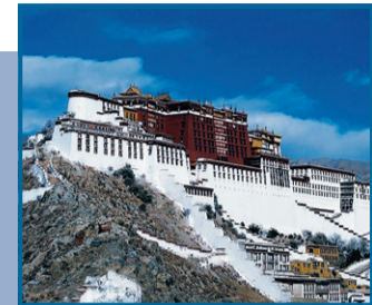
PAURA A sinistra, la copertina di "Asia misteriosa"; a destra, Tibet Palazzo del Potala

particolare i Tre Saggi supremi che comunicherebbero direttamente con chiunque utilizzi il sistema in questione. Non è fuori luogo rammentare che, oltre al citato Guénon, anche Ossendowski e d'Alveydre collocarono in Oriente il centro d'una sapienza segre-